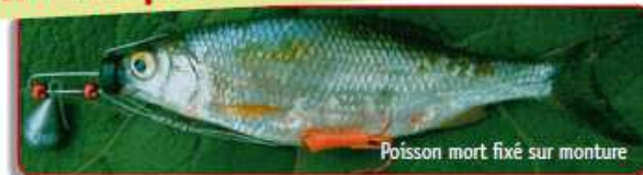
Poisson mort fixé sur monture

Pour ressentir les touches, la bannière (partie du nylon entre le scion et le poisson mort) doit rester parfaitement tendue pour garder le contact, la majorité des attaques ayant lieu dans la phase descendante de l'animation. Cette technique est la plus sportive des pêches de carnassiers. Elle réclame une bonne connaissance des lieux prospectés et une grande sensibilité tactile et visuelle pour percevoir les plus infimes tirées ou déplacements anormaux du fil en surface. Ces indicateurs traduisent la présence d'un carnassier en train de se saisir du poisson mort. Ils doivent être sanctionnés par un ferrage rapide et puissant, car le carnassier rejette aussi vite qu'il attaque lorsqu'il découvre le subterfuge. Parfois difficiles à déceler pour un pêcheur inexpérimenté, ces sensations de pêche sont parmi les plus intenses.