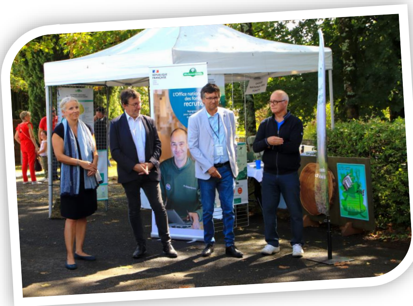
Présidents de la Fédération de chasse et de pêche, en compagnie de la Députée Delphine BATHO et du Président du PNR du Marais Poitevin, M. DUFORESTEL

Le samedi 2 septembre a eu lieu le centenaire de la Fédération de pêche des Deux-Sèvres et de la Fédération Départementale des Chasseurs des Deux-Sèvres. Avec plus de 60 exposants venant de tous horizons, les 3 000 visiteurs ont pu découvrir les multiples facettes du monde halieutique et du monde cynégétique.